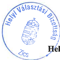
Kadlicskó Ágnes Helyi Választási Bizottság Elnöke